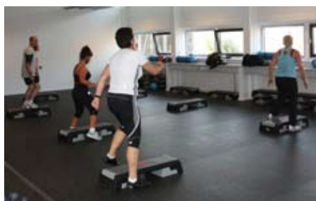
Fuld gang i aktiviteterne i de nye lokaler i FRH