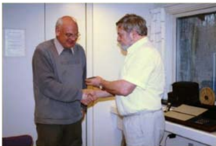
Steen får overrakt manchetknapper